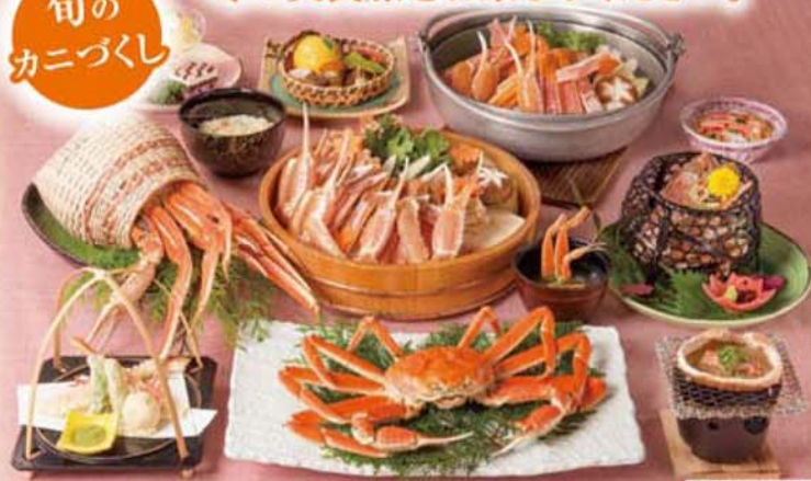
冬の会席料理一例