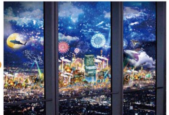
※画像は2018年のものです。