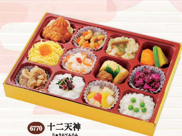
6770 十二天神 じゅうにてんじん