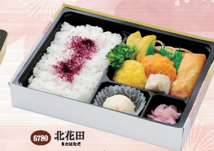
6780 北花田 きたはなだ