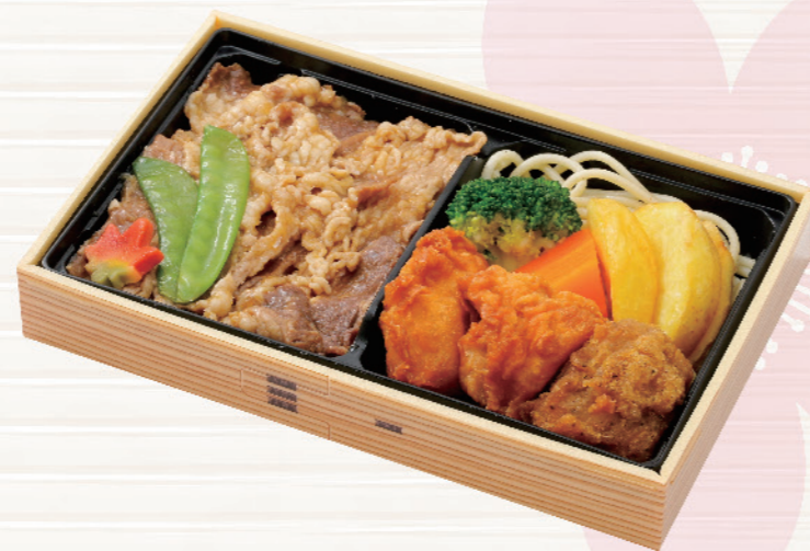
6771 牛すき焼きとりから弁当