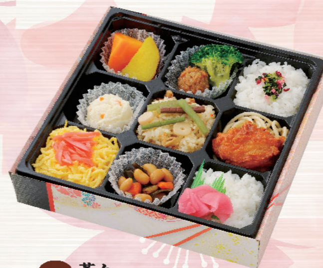
6774 茶々 ちゃちゃ