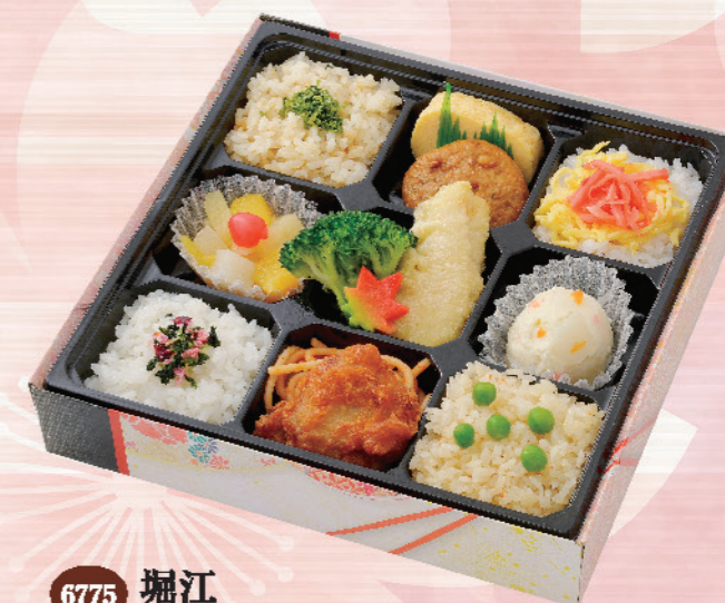
6775 堀江 ほりえ