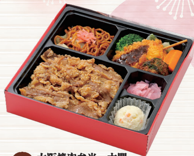
6763 大阪焼肉弁当・太閤 たいこう