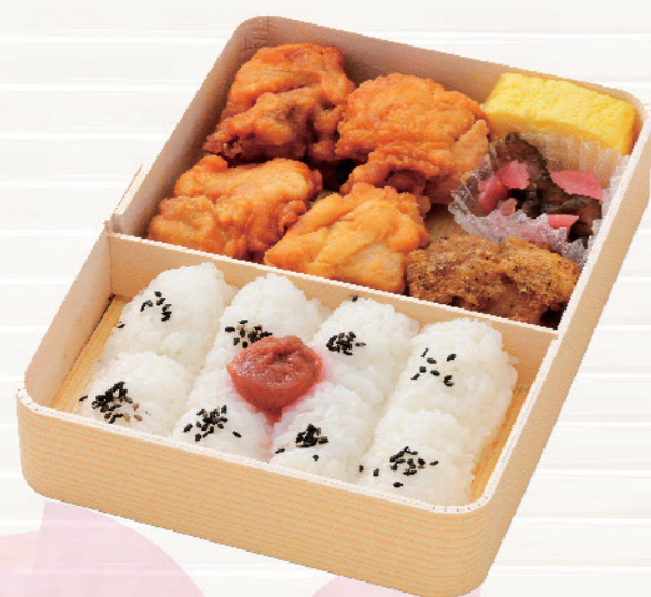
6766 鶏の味三昧! 唐揚げ弁当