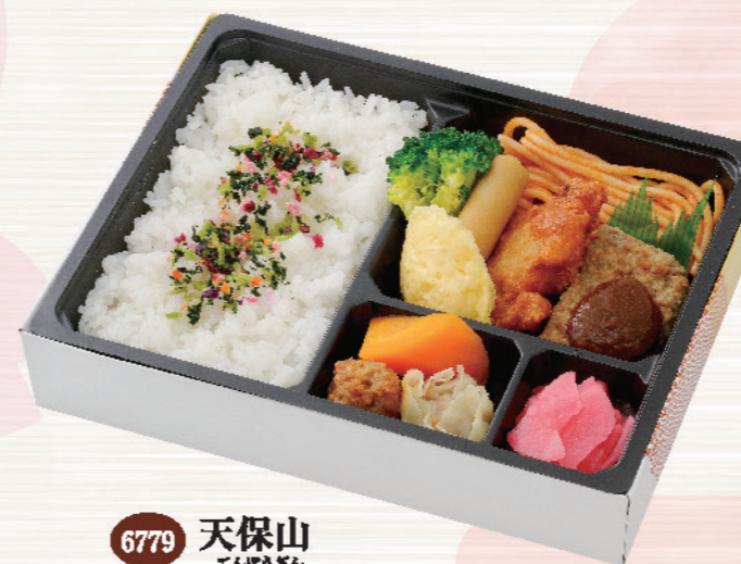
6779 天保山 てんぼざん