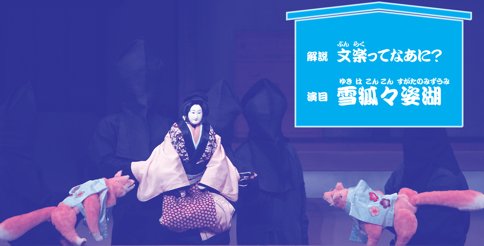
「雪狐々姿湖」