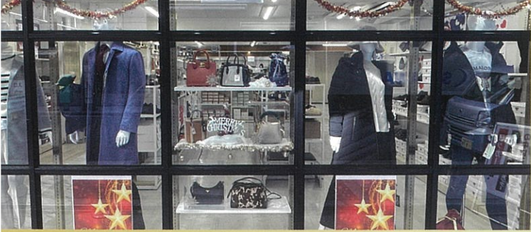
萬栄プレミアム館 ワンランク上のラグジュアリー&スタイリッシュ空間

おかげさまで、創業75周年。 商売の聖地“大阪船場”で 日本全国からプロが通う「卸売問屋」。 萬栄なら百貨店を彷彿とさせる品揃えの中から 暮らしのアレコレを一点からまとめ買いまで いつでも問屋価格でご購入いただけます。