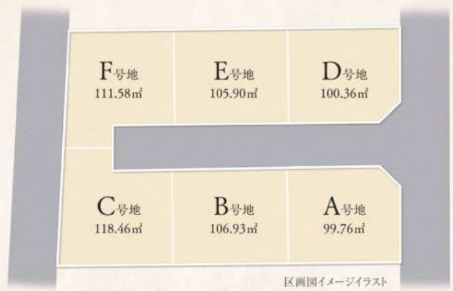
区画イメージイラスト