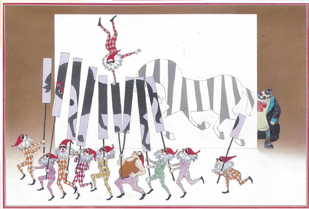
「ふしぎなえ」1971年 津和野町立安野光雅美術館 ©空想工房