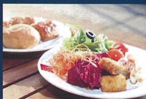
1F「サルヴァトーレ クオモ&パール」 の和洋ビュッフェ