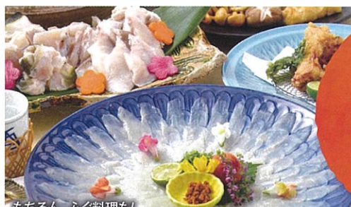
もちろん、ふく料理も!