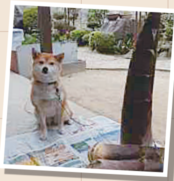
No.016 「でっかいタケノコ」 千早赤阪村 O様

おすすめ・お気に入りの募集をしています。 氏名・職員番号・所属校園・連絡先・写真の説明を添えてご応募ください！