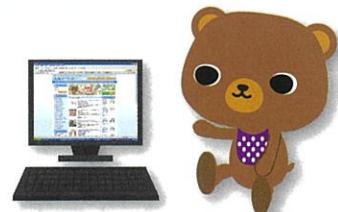
社販マーケットイメージキャラクター ジャチャぼう