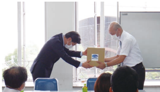
▲貝塚市立学校園教職員厚生会にて寄贈