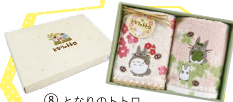
⑧ となりのトトロ タオルセット