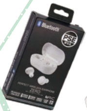
⑩ ワイヤレス イヤホン