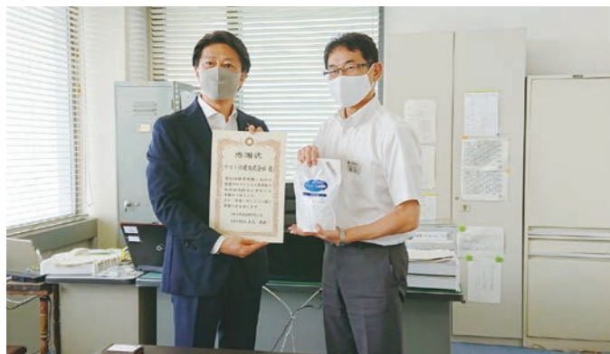
▲豊中市教育委員会にて寄贈