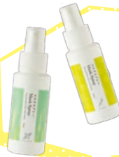
③ 生活の木 マスクプレー 2本セット