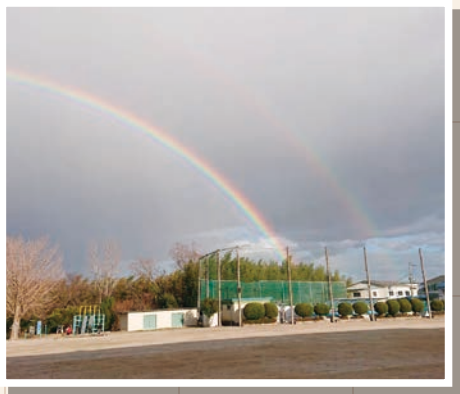
No.006 「校庭で見つけた虹」 茨木市 I様

おすすめ・お気に入りの募集します 氏名・職員番号・所属校園・連絡先・写真の説明を添えてご応募ください！