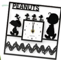
⑦ SNOOPY アクリルクロック