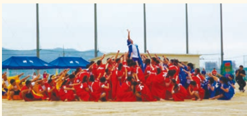
▲体育祭でのソーラン節