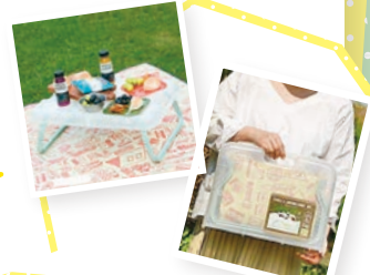
⑤ ツェルト ノスタルジック テーブルシートセット

このページの商品はすべて fanbi 寺内で手に入るモノです。 今回はこれらを各1名さまにプレゼントします。