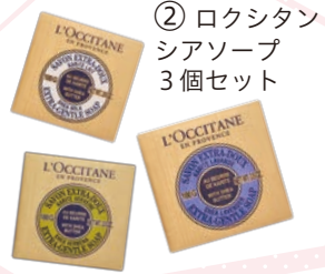
② ロクシタン シアソープ 3個セット