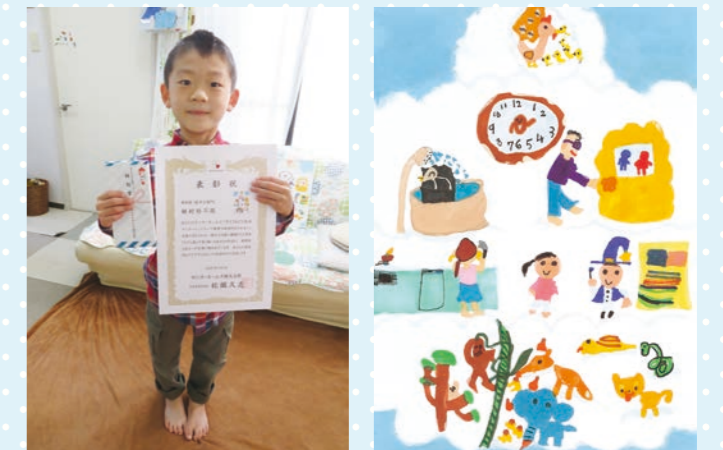
今年は残念ながら表彰式を行えずご自宅での表彰となりました。