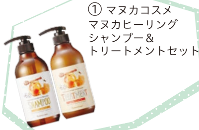
① ママカコスメ ママカヒーリング シャンプー& トリートメントセット