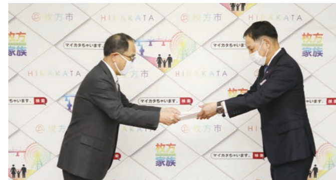
▲枚方市教育委員会にて寄贈