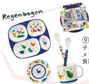
⑨ Regenbogen 子ども用 メラミン 食器セット