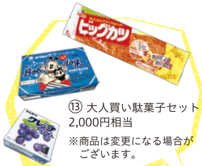
⑬ 大人買い駄菓子セット 2,000円相当 ※商品は変更になる場合がございます。