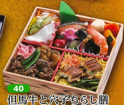
40 但馬牛と穴子ちらし膳 18×18cm