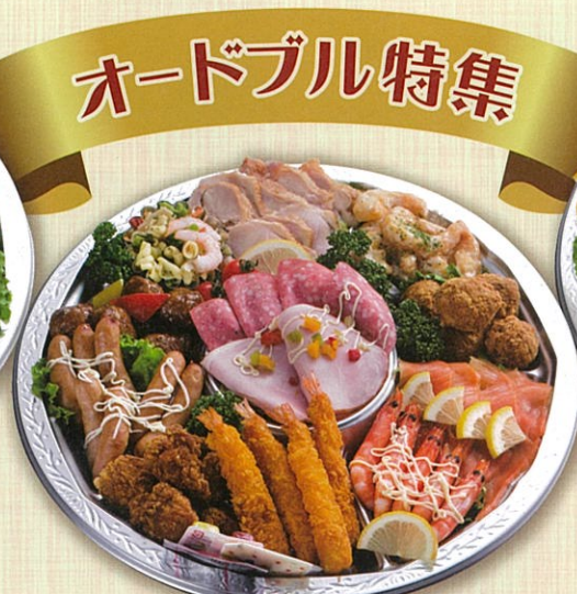
47 洋風オードブル 直径40cm(5~7名盛)