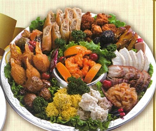
48 中華オードブル 直径40cm(5~7名盛)