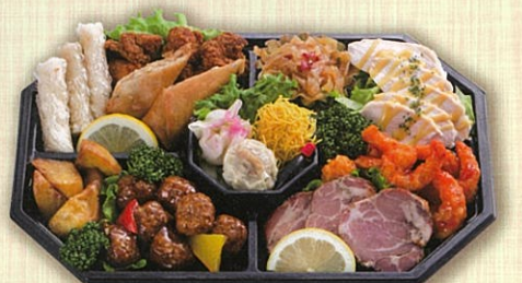
51 中華オードブル 36×24cm