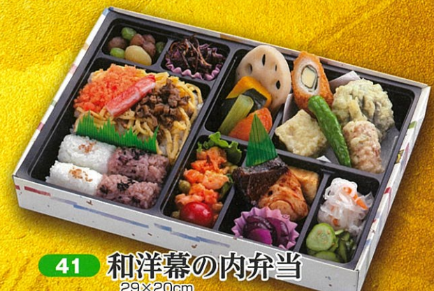
41 和洋幕の内弁当 29×20cm