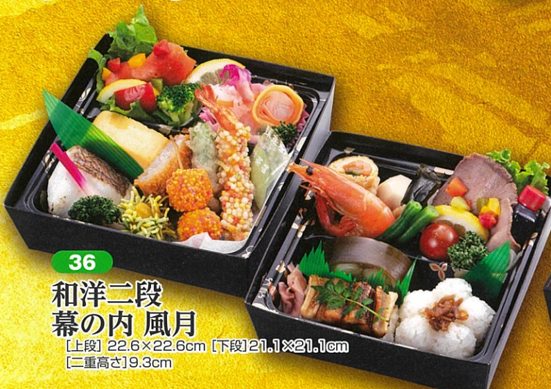
36 和洋二段幕の内風月 【上段】22.6×22.6cm 【下段】21.1×21.1cm 【二重高さ】9.3cm