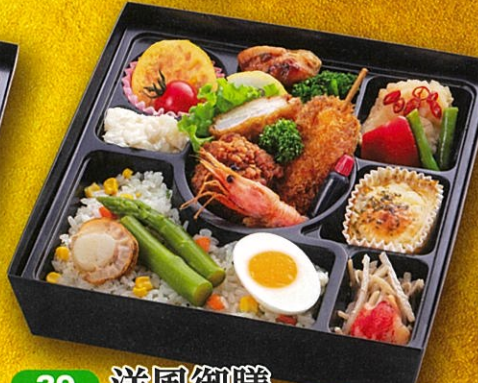
39 洋風御膳 21.5×21.5cm