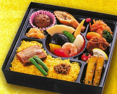
38 中華餡かけ御膳 21.5×21.5cm