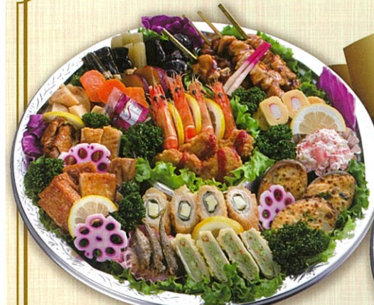
46 和風オードブル 直径40cm(5~7名盛)