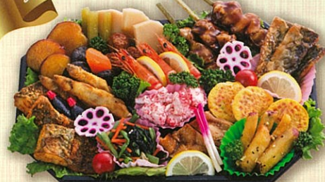
49 和風オードブル 36×24cm