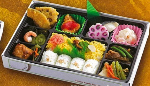
45 ちらし幕の内弁当 27.5×18cm