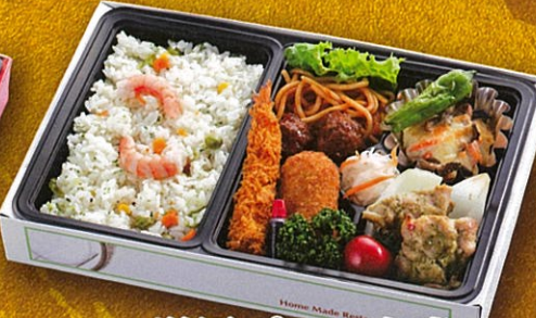
44 洋風ピラフ弁当 27.5×18cm