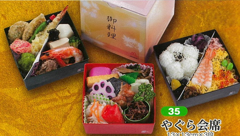
35 やぐら会席 13×13cm×3段