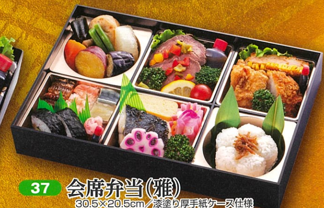
37 会席弁当(雅) 30.5×20.5cm / 漆塗り厚手紙ケース仕様