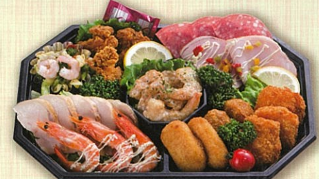
50 洋風オードブル 36×24cm