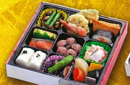
43 彩り幕の内弁当 21.5×21.5cm