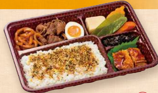
商品番号 8054 すき焼きDX 25.6×19.0(cm) ごはん大盛 牛すき焼&味のしみたうどん、相性ばっちりのゆで卵がうれしい。煮物や鶏もも肉の照焼、昆布の佃煮も入れて、ご飯の進むお弁当に仕上げました。