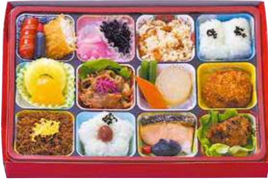
商品番号 8047 洋風ゴージャス弁当 29.0×20.5(cm)

牛焼肉、鶏の黒ごま揚、ミンチカツ、焼鮭など、人気おかずと煮物・フルーツ・四種のご飯を盛り合わせた、最後の一口までおいしいゴージャスなお弁当です。