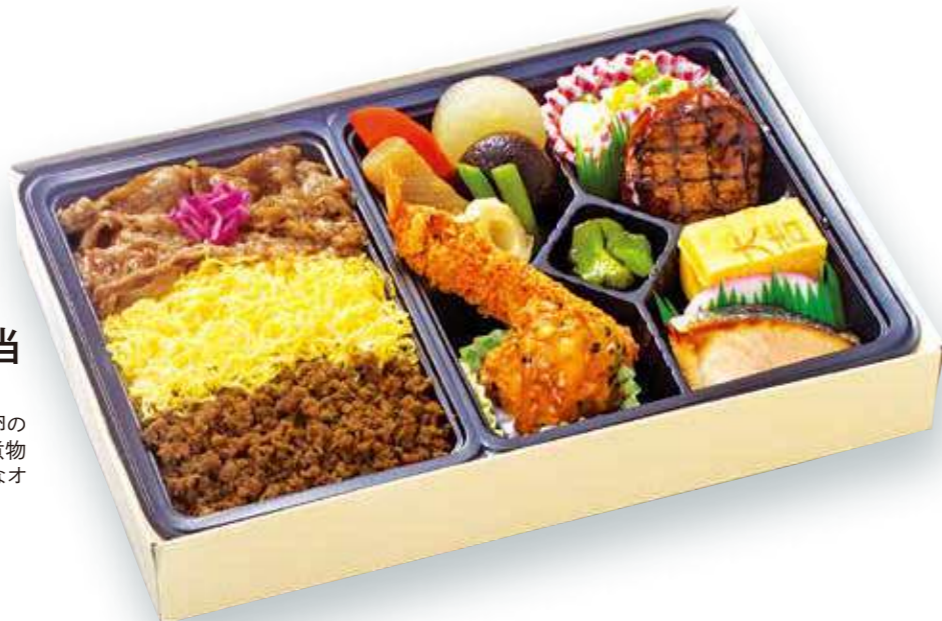
商品番号 8048 三色そぼろ焼肉弁当 28.5×18.5(cm)

特製タレの牛焼肉&鶏そぼろ&錦糸卵の三色ご飯、海老フライ・ハンバーグ・煮物など。おかずたっぷり、見た目も豪華なおススメお弁当です。