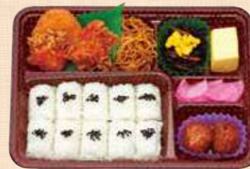
商品番号 8057 からあげDX 25.6×19.0(cm) 定番人気の鶏の唐揚、甘酢あんかけ肉団子、野菜コロッケ、ひじき煮や出し巻など。唐揚げだけでは足りない方におすすめです。