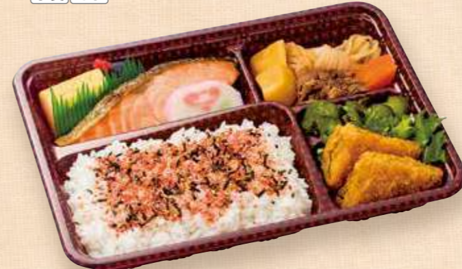
商品番号 8055 焼鮭DX 25.6×19.0(cm) ごはん大盛 素材の味を活かした鮭の塩焼をメインに、肉じゃが・関西風出し巻玉子・カレーコロッケ・胡瓜漬を詰めた、定番人気の鮭弁当です。