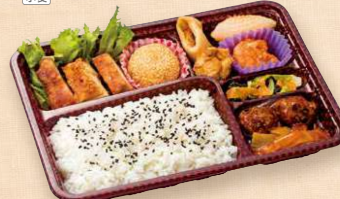
商品番号 8056 中華DX 25.6×19.0(cm) ごはん大盛 野菜あんかけ肉団子、イカの豆板醤炒め、海老チリ・焼売・春巻など中華風の定番メニューを一度に楽しめるお弁当です。デザートには香ばしいゴマ団子をどうぞ。