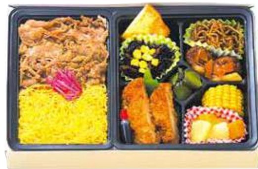
商品番号 8045 二色焼肉チキンカツ弁当 28.5×18.5(cm)

焼肉&錦糸卵の二色ご飯にチキンカツ、野菜あんかけ肉団子、焼そばやフルーツなど、色んなおかずをバランスよく詰め合わせました。