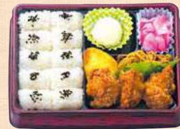
商品番号 8049 からあげ弁当 22.5×17.0(cm) 人気! 外はカラッと中はジューシーな鶏の唐揚は、昔から変わらない人気メニュー。ポテサラ・焼そば・オムレツなどサイドメニューも充実です。