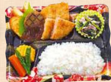
商品番号 8061 ハンバーグミックスDX 23.5×19.5(cm) デミハンバーグにハムカツ・白身魚フライをプラス、コーンやグラッセなどハンバーグにぴったりな付け合わせも添えて。洋風のミックス弁当です。