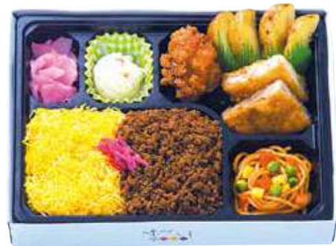
商品番号 8046 二色そぼろトンカツ弁当 24.5×18.5(cm)

ご飯の進む鶏そぼろ&錦糸卵の二色ご飯、トンカツ&鶏の唐揚、ナポリタンやポテサラなど、食べ応えのあるメニューを詰め合わせました。