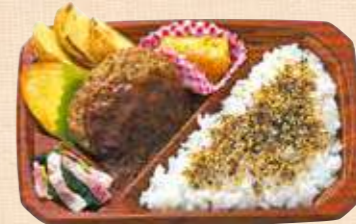
商品番号 8053 デミハンバーグ弁当 22.8×15.4(cm) デミソースをたっぷりかけた特製ハンバーグ、オムレツやカレーコロッケ・ホウレン草&ベーコンソーテーなど、洋風のおかずを盛り合わせました。