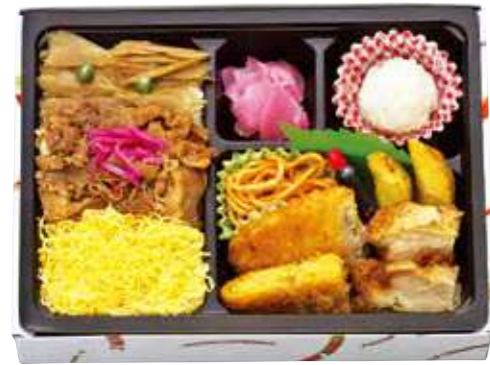
商品番号 8140 洋風焼肉DX 24.5×18.5(cm)

特製タレで味付けした牛焼肉の三色ご飯、鶏の南蛮揚、ナポリタン、ポテサラ・カレーコロッケなど、ご飯の進むデラックスなお弁当です。